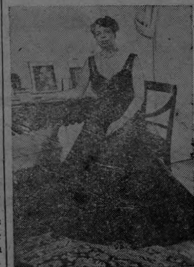
Fotografía de la Sra. Roosevelt en la Casa Blanca.

Durante siglos, ha sido el hombre quien ha hecho la guerra; justo parece insinuar que la mujer podría contribuir a hacer una paz duradera. Por naturaleza, la mujer tiende a conservar la vida; el hombre, a derrocharla. Ha empe-