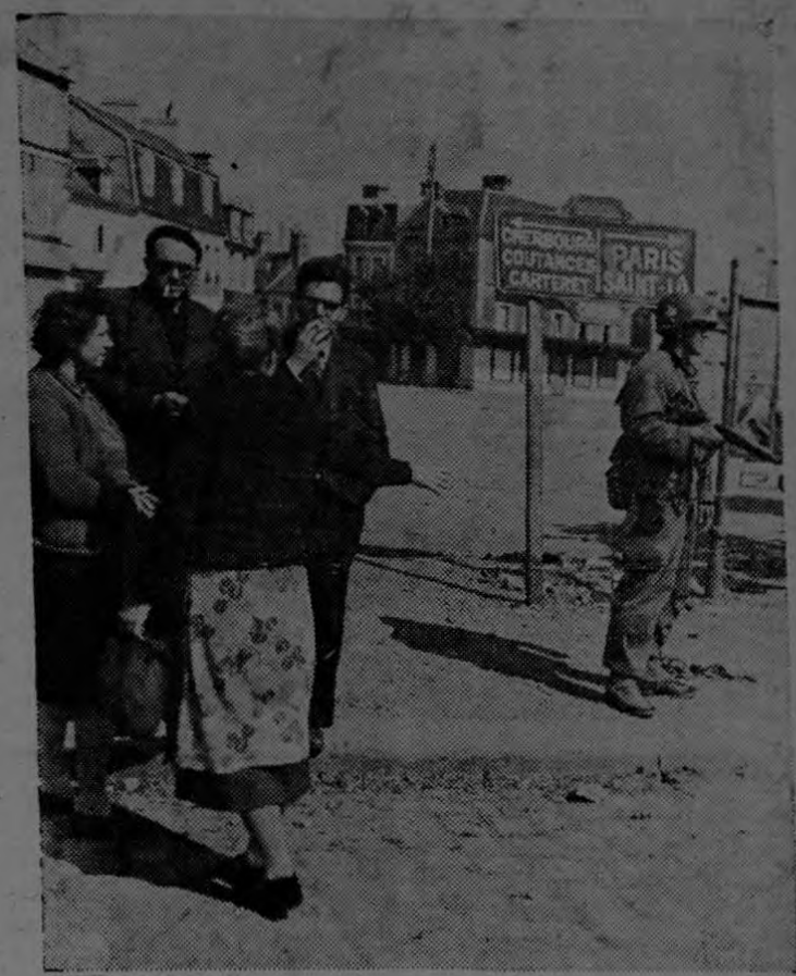
Grupo de civiles franceses de la ciudad de Carentan, en Normandía, discuten las últimas noticias de la guerra mientras monta guardia un soldado estadounidense. Las flechas de la tablilla señalan hacia las próximas metas del avance aliado.

circulación, se dió plena cuenta de que estaban llamadas a ser muy populares.